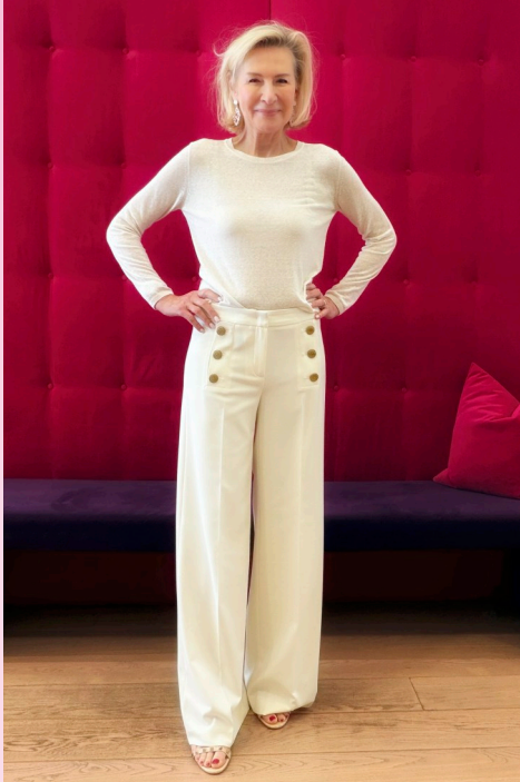
IRIS VON ARNIM