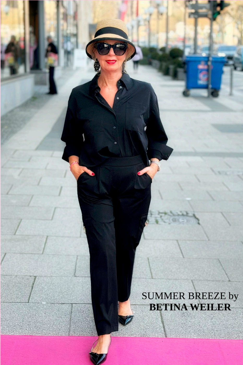
SUMMER BREEZE by BETINA WEILER