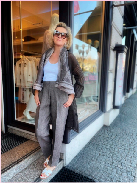
IRIS VON ARNIM